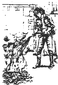
TRUBBEL FÖR KERRY